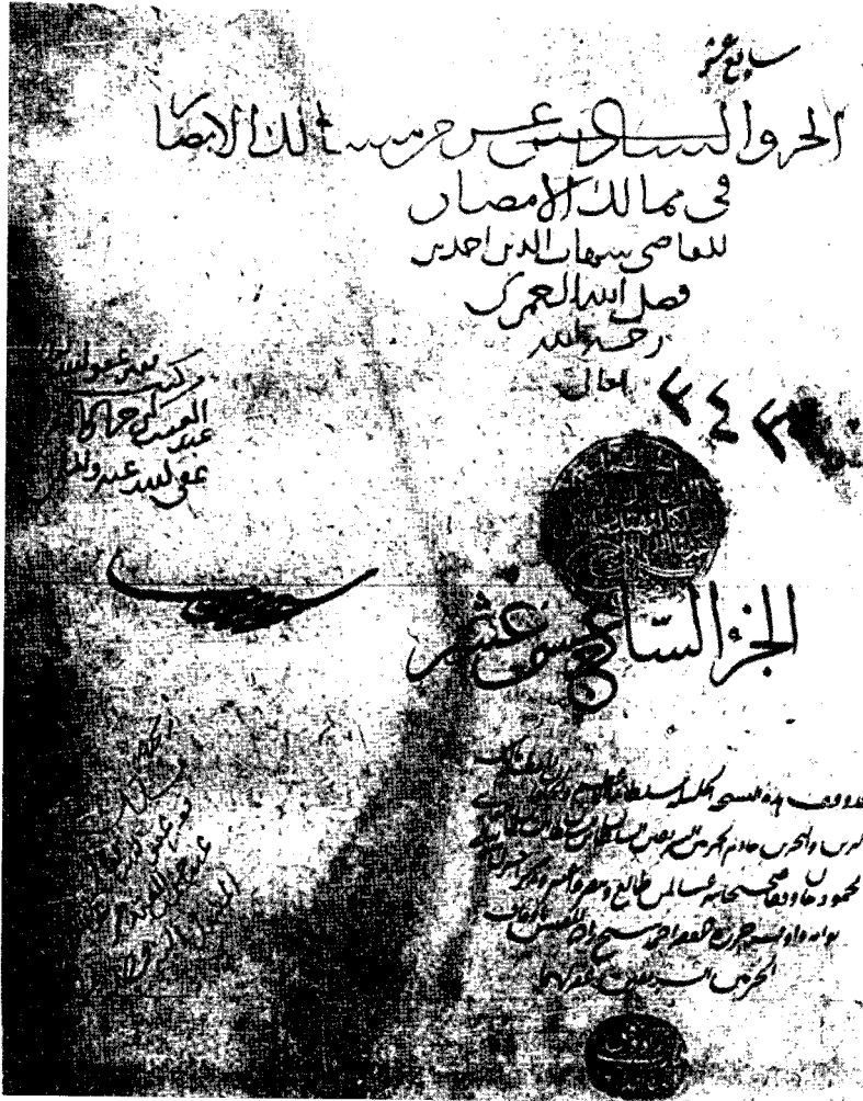
صفحة العنوان - مخطوطة أيا صوفيا - المكتبة السليمانية - استانبول رقم ٣٤٣٧